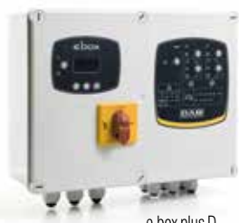
e.box plus D