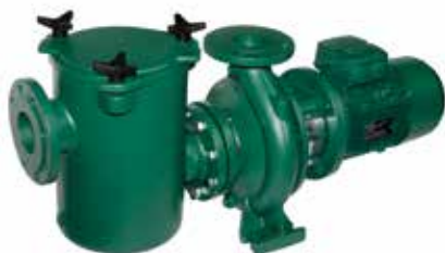
PREFILTRO + BOMBA

Gama de prefiltros de fundición en línea con la norma DIN 2501, de DN 65 a DN 200. Provisto de 3 o 4 pernos de cierre en función del modelo para asegurar un perfecto sellado de la tapa. Prefiltro y tapa de hierro fundido, cesta en acero inoxidable AISI 316. La gama de prefiltros permite el uso de bombas centrífugas monoblock serie NKM-G, NKP-G, de DN 40 a DN 150, para la circulación de agua en sistemas de filtración de gran tamaño. Los mismos prefiltros pueden ser utilizados con bombas normalizadas sobre bancada (KDN) o con variador de velocidad MCE.